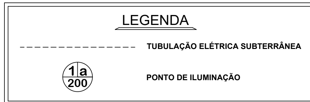
Planta Baixa Elétrica : PRAÇA Escala : 1 : 250